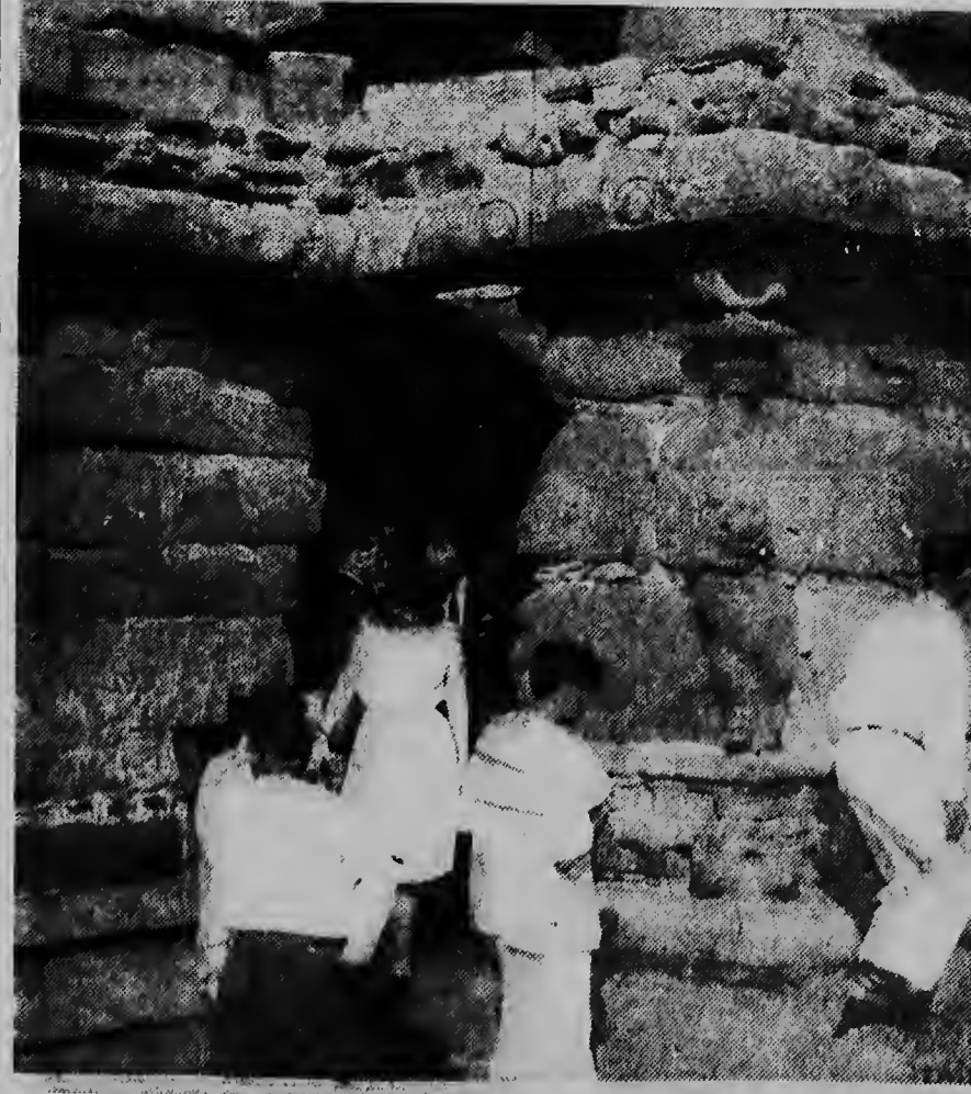
Princesa Beatrix cu actualmente ta permanece na Thailand ta bandonando un dje templojan di Malabaliporan na e orilla 50 kilometer di distancia foi Madras, durante su viahe door di India.

E delegacion for di Guyana Ingles, cu ta consisti di gobernador, sir Ralph Grey, premier dr. Cheddi Jagan, y e lider di oposicion, Forbes Burnham, lo no hiba Hulanda mas, manera tabata e plan, pa papia tocante e kestion di frontera cu Surinam. E viaje pa Hulanda di e delegacion a wordo suspende en relacion cu e conferencia na Londen tocante independencia di Guyana Ingles.